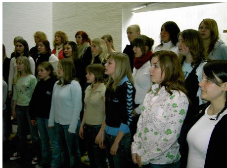
Opvarmning i Fønnesbæk kirke den 10. april i år